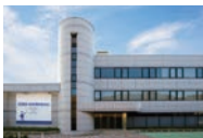
岡山本社・ショールーム館