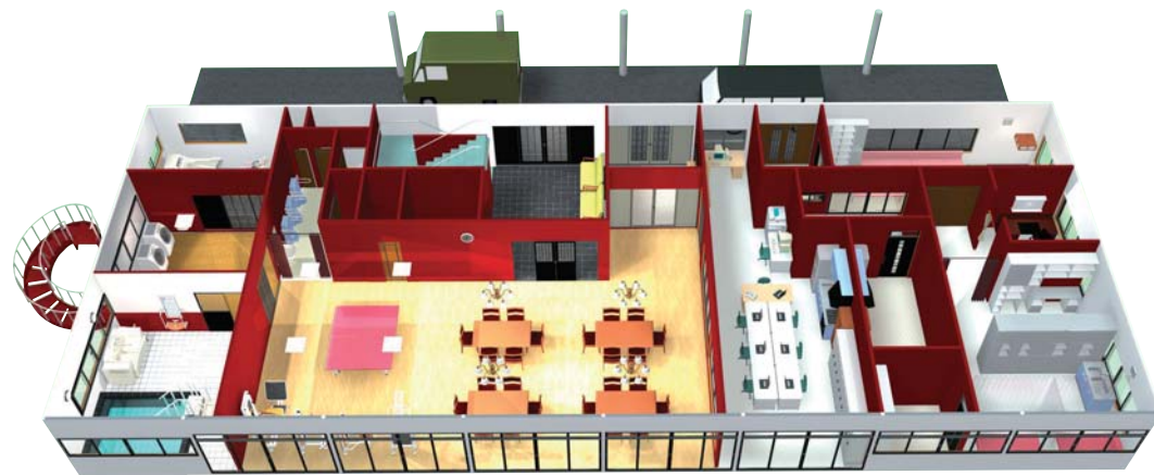
1F デイサービスセンター 訪問介護ステーション 在宅療養支援診療所