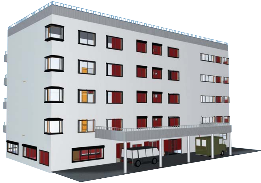
2~5F 住宅型有料老人ホーム(32個室)

参考例: デイサービスセンター・訪問介護ステーション・在宅療養支援診療所 併設型